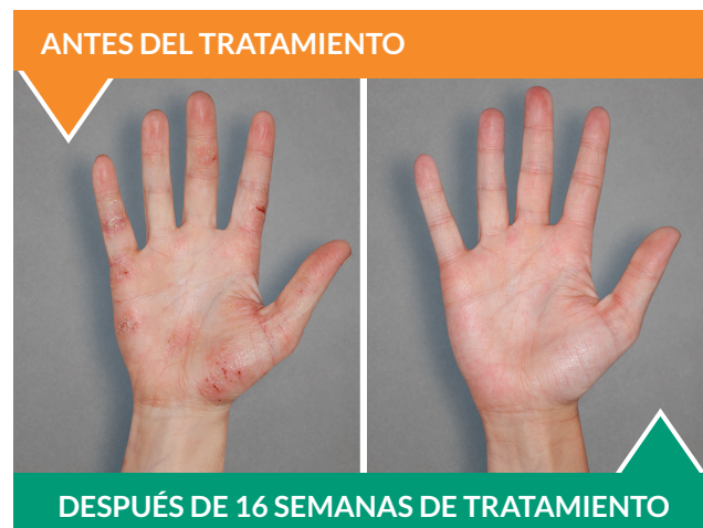
Paciente adulto real*.

† A todos los pacientes se les recetaron corticosteroides tópicos (CST) de potencia baja o media según el programa del ensayo clínico.