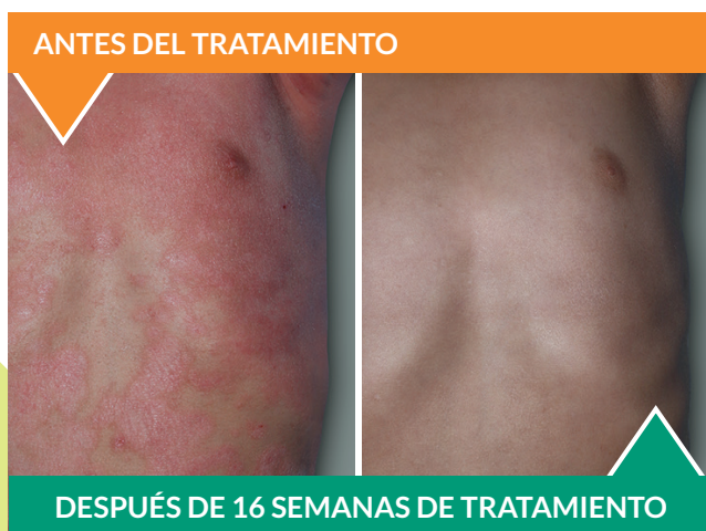
Paciente real de 4 años en el ensayo clínico. † Los resultados individuales pueden variar.

El eczema puede afectar a cualquier persona, independientemente de su raza, origen étnico o género, y puede aparecer de manera diferente en diferentes tipos de piel. En algunos casos, el sarpullido del eczema podría verse rojo, gris, marrón o morado. DUPIXENT ha demostrado una eficacia generalmente constante independientemente de la raza/origen étnico en estudios con adultos.