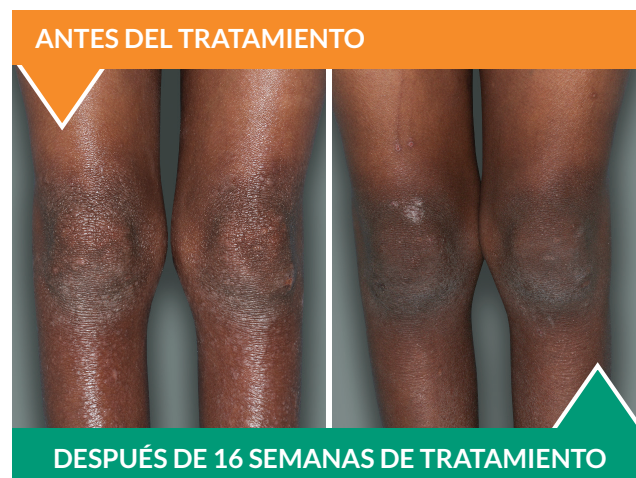
Paciente real de 6 años de edad en el ensayo clínico. † Los resultados individuales pueden variar.

INFORMACIÓN IMPORTANTE DE SEGURIDAD: Los efectos secundarios más comunes en pacientes con eczema son reacciones en el lugar de la inyección, inflamación de los ojos y los párpados, que incluyen enrojecimiento, hinchazón y picazón, a veces con visión borrosa, herpes en la boca o en los labios, y un alto recuento de ciertos glóbulos blancos (eosinofilia).